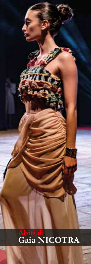
Abiti di Gaia NICOTRA