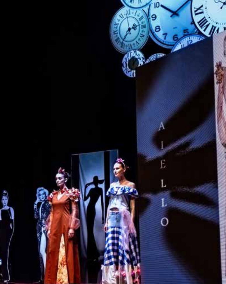
Abiti di Giandomenico AIELLO