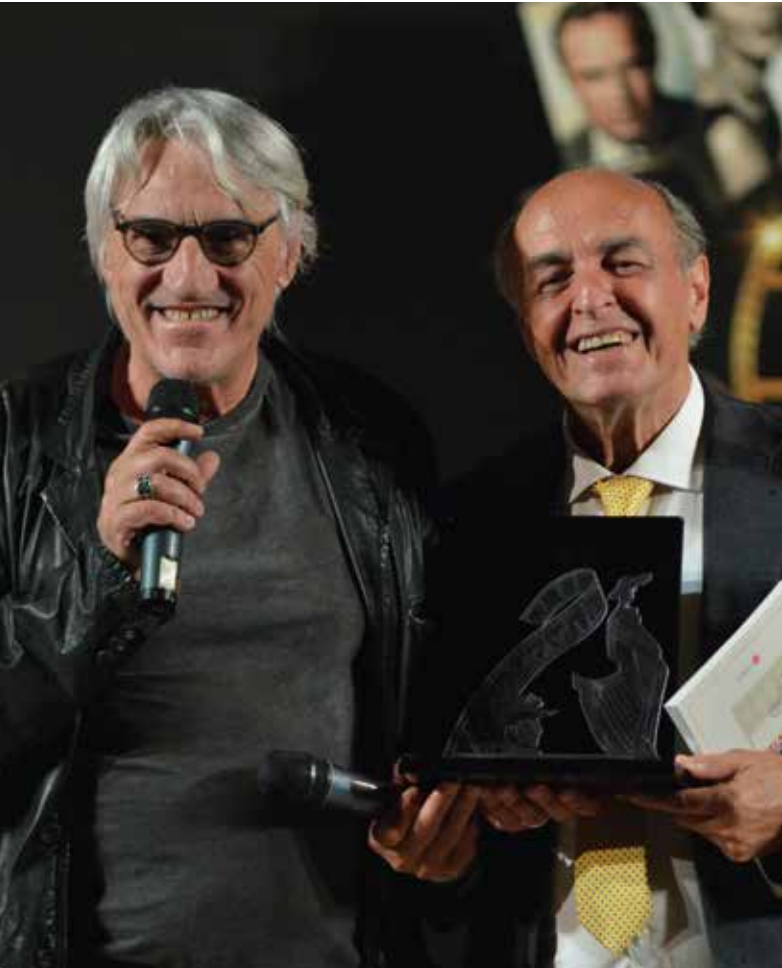
Premio cinema 2023 Mimmo CALOPRESTI